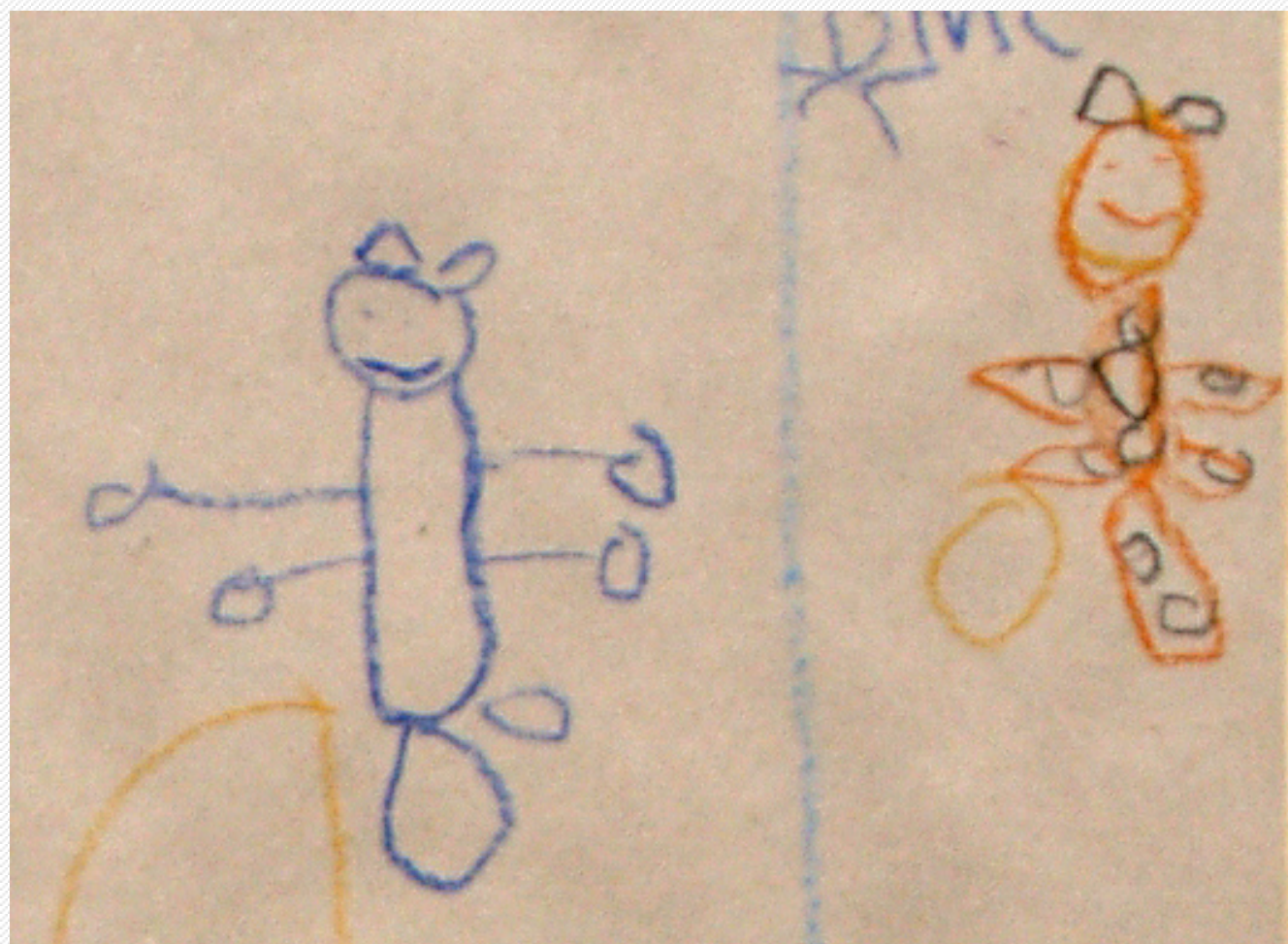
Bild från teckningen Orsa björnpark som visar en vit tiger och en leopard.